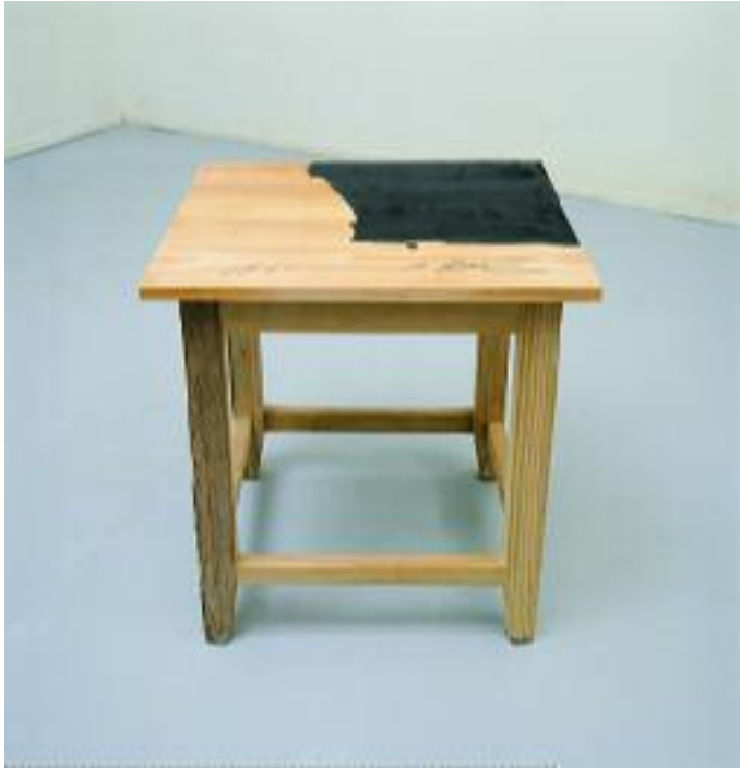
Sitz- und Malfläche