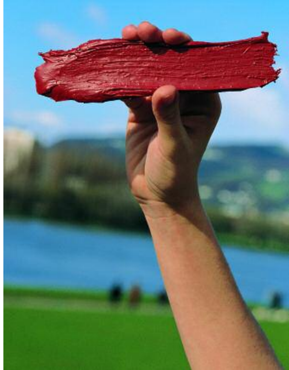
Landschaftsmalerei: Linz, Blick gegen Norden