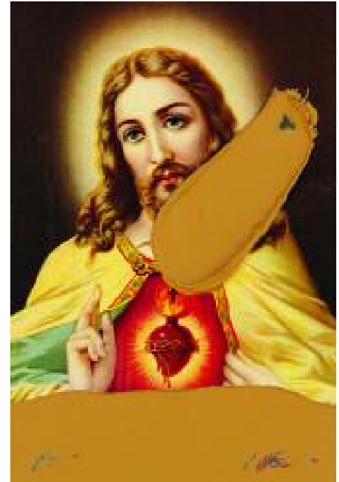
Ablichtung einer Reproduktion